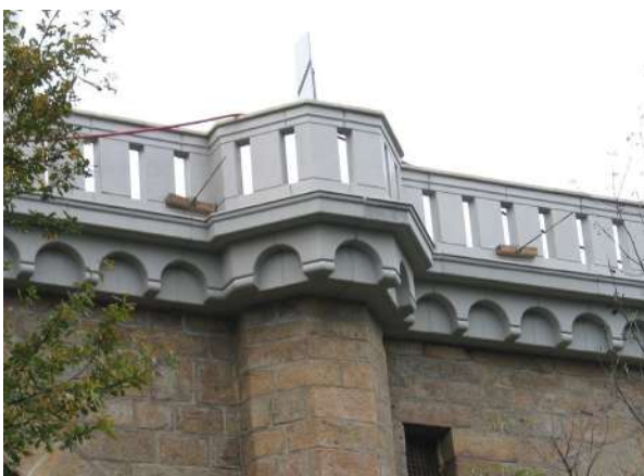
Fot. Most Zgorzelec - Goerlitz