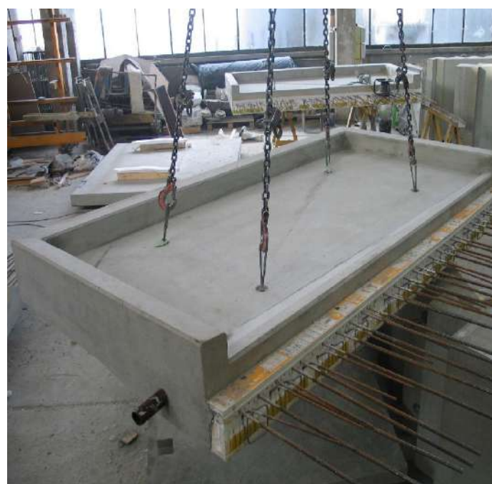
Fot. Balkon z odwodnieniem

Gwarantujemy wieloletnie bezproblemowe użytkowanie i estetyczny wygląd balkonów. Podobnie jak w schodach istnieje możliwość wbudowania przepustów elektrycznych, opraw oświetleniowych czy kotew do montażu balustrad.