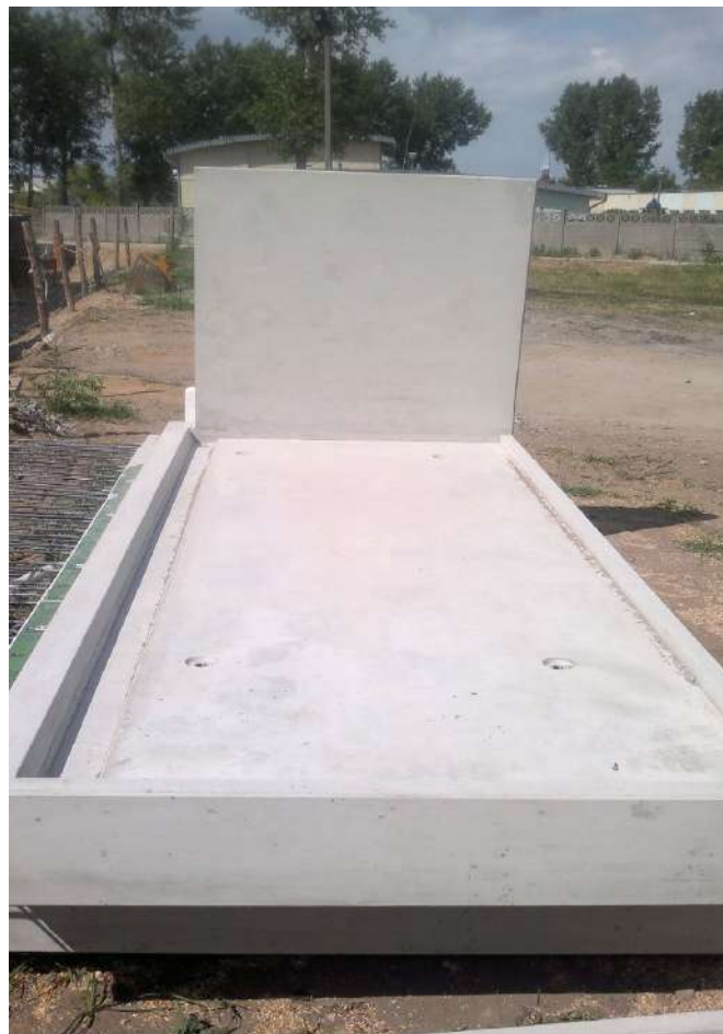
Fot. Balkon z balustradą betonową

w wersji alternatywnej (korzystniejszej kosztowo) wykonywanej są z tzw. wiązaniem skupionym, oddzielnym wkładkami termoizolacyjnymi ze styropianu.