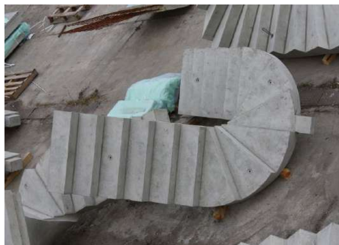
Fot. Schody zabiegowe