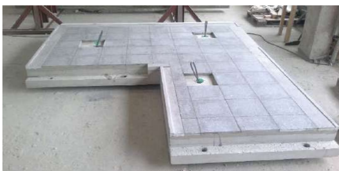
Fot. Podesty z terazzo