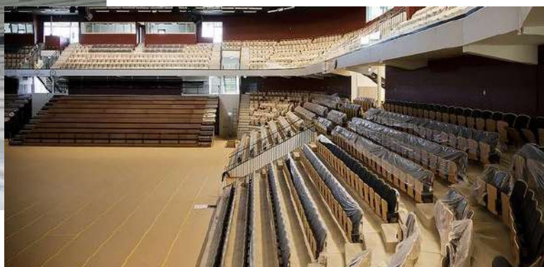
Fot. Kristianstadt Arena - w budowie... ... i po zakończeniu