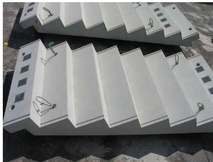
Fot. Schody, beton architektoniczny z terazzo

Tym samym nasze schody, balkony, trybuny sportowe czy ławki można odnaleźć w Warszawie, Wrocławiu, Krakowie, Poznaniu, Gdańsku, Berlinie, Lipsku, Hannoverze, Stuttgartcie, Monachium czy też w Sztokholmie, Bekestui, Skalgrenska, Kristianstadt, Halmstad, Helsingborg, Trondheim, Oslo.