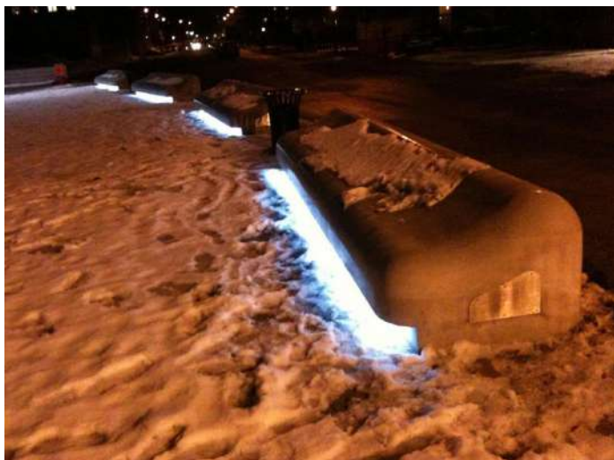
Fot. ławka - ... i już w Szwecji (Malmö)