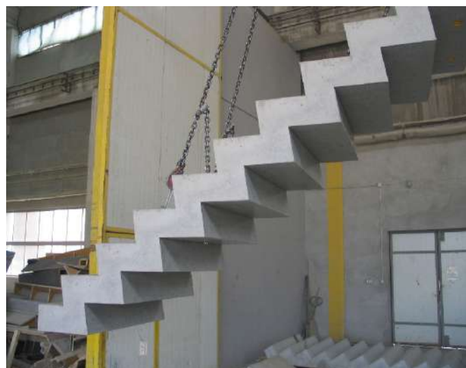
Fot. Schody profilowe

- z wbudowanymi elementami do montażu balustrad