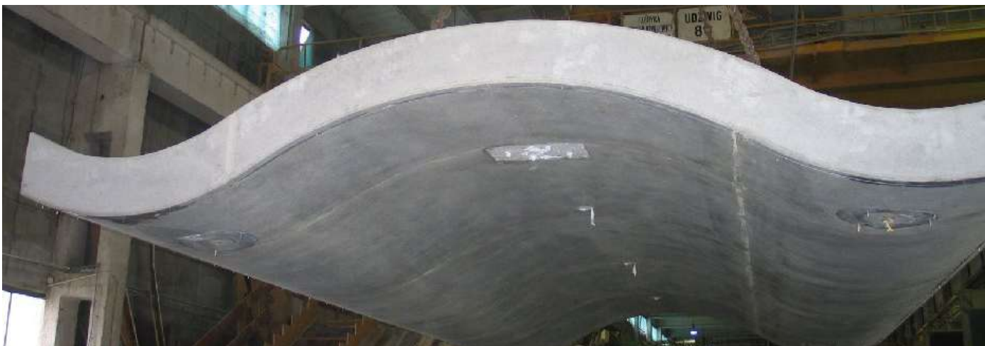
Fot. Pagoda buddyjska Wrocław