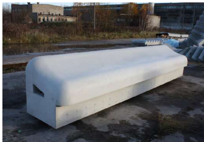
Fot. ławka - jeszcze w Polsce...

Do grona naszych kontrahentów należą krajowe i zagraniczne oddziały takich firm jak Hochtief, Skanska, Kajima, NCC jak i inne firmy budowlane występujące w charakterze Generalnego Wykonawcy lub Podwykonawcy zarówno z kraju jak i zagranicą (Reinertsen - Norwegia, Skandius - Szwecja, PEKABEX, Ergon, Comfort - Polska, UAB Markuciai - Litwa, Firesta - Czechy).