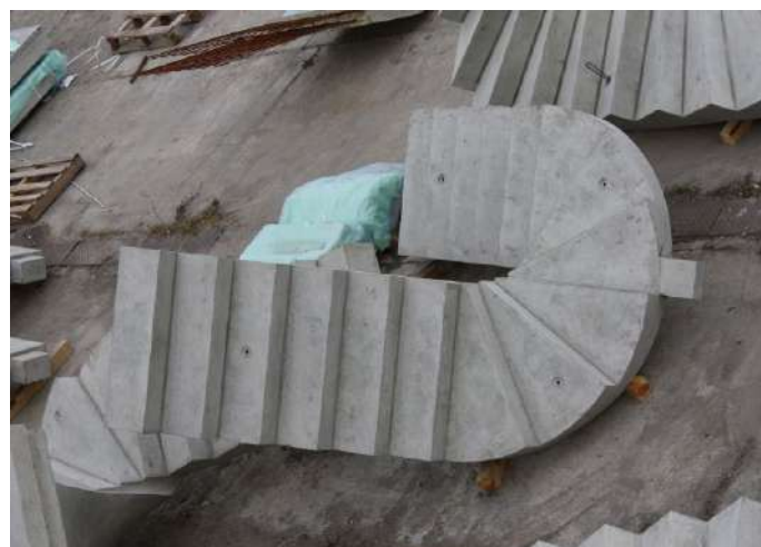
Bild. Vinkel-, svängtrappor