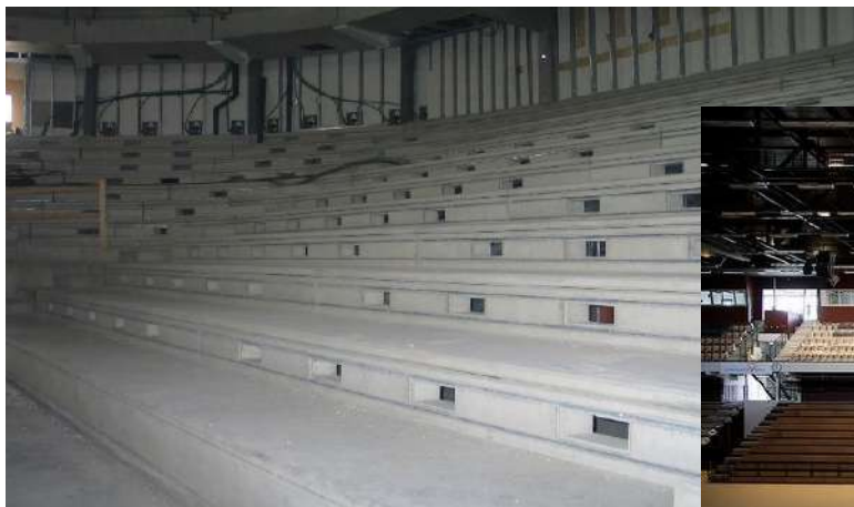
Bild. Kristianstadt Arena - under uppförande...

Bästa exemplet är presenterade tidigare bänkar med värmeinstallationer, levererade till Malmö och Trondheim, kupolen till buddhistisk pagod i Wrocław och broräcken för tågbron Zgorzelec-Görlitz.