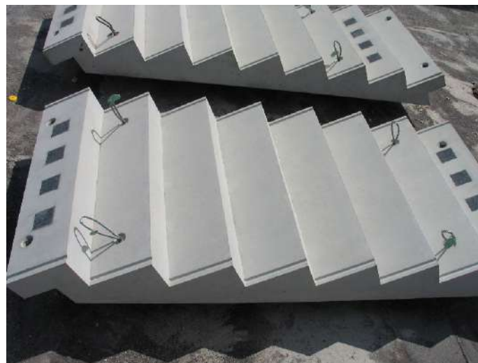
Bild. Trappor, arkitektonisk terrazzobetong

Vår huvudsakliga kompetens ligger i tillverkning av alla slags prefabricerade trappor och avsatser i flera utföranden: