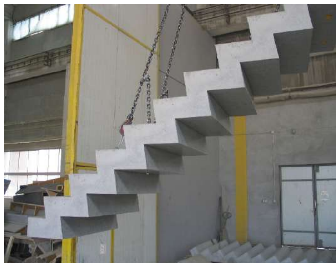
Bild. Profilerade trappor

Standardutförande för montering av trappor till innertak eller avsatser utgörs av en betongkonsol. Vi tillämpar även systemelement från bl. a. Philipp, Shoeck, J&P, H-Bau.