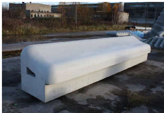
Bild. Bänken - ännu i Polen

Våra trappor, balkonger, bänkar och läktare kan man hitta i Stockholm, Bekkestua, Sahlgrenska, Kristianstad, Halmstad, Helsingborg, Trondheim, Oslo.