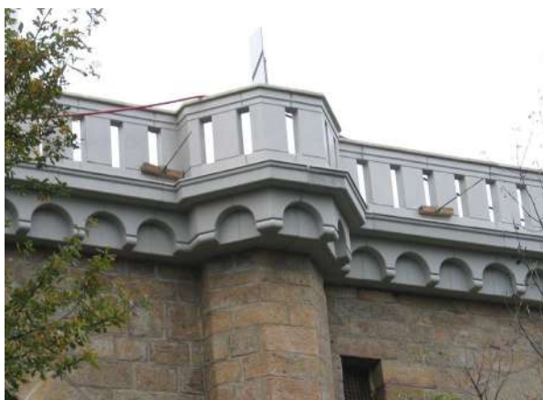
Bild. Bron Zgorzelec - Görlitz