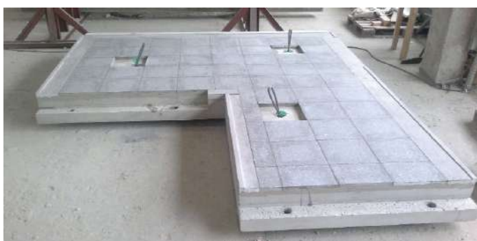
Bild. Avsatser i terrazzo