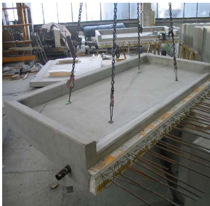
Bild. Balkong med vattenavledning

Balkonger kan utrustas med inbyggda termoiserande infästningar (t ex isokorb el dyl.) eller som alternativ (kostnadsmissigt mer fördelaktigt) tillverkade med s.k. koncentrerade infästningar avdelade med termoiserande frigolitlägg.